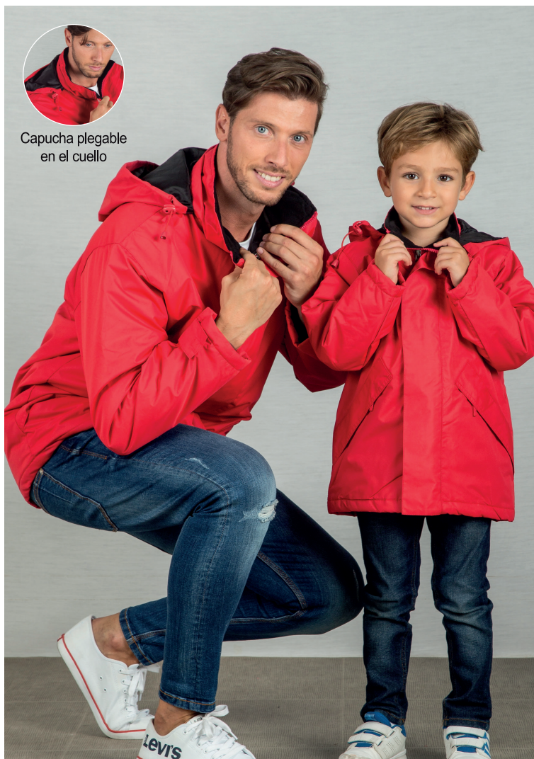
Capucha plegable en el cuello