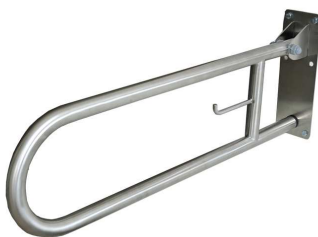
REF: MB-0102-S Acabado SATINADO