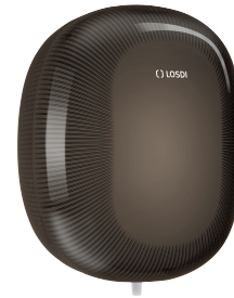
REF: CP-5011-BL Acabado NEGRO