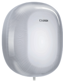
REF: CP-5011-B Acabado BLANCO