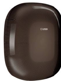
REF: CP-5009-BL Acabado NEGRO