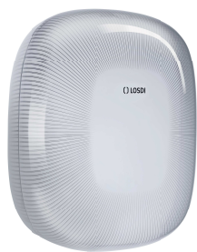
REF: CP-5009-B Acabado BLANCO