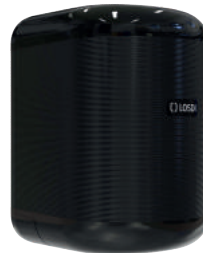
REF: CP-3010-C-BL Acabado NEGRO