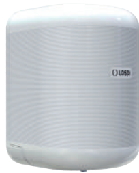
REF: CP-3010-B Acabado BLANCO